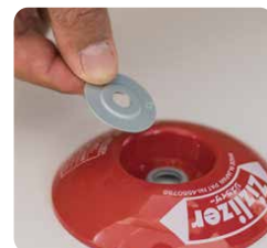
本体凹部にセット